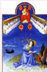
In principio era il Verbo